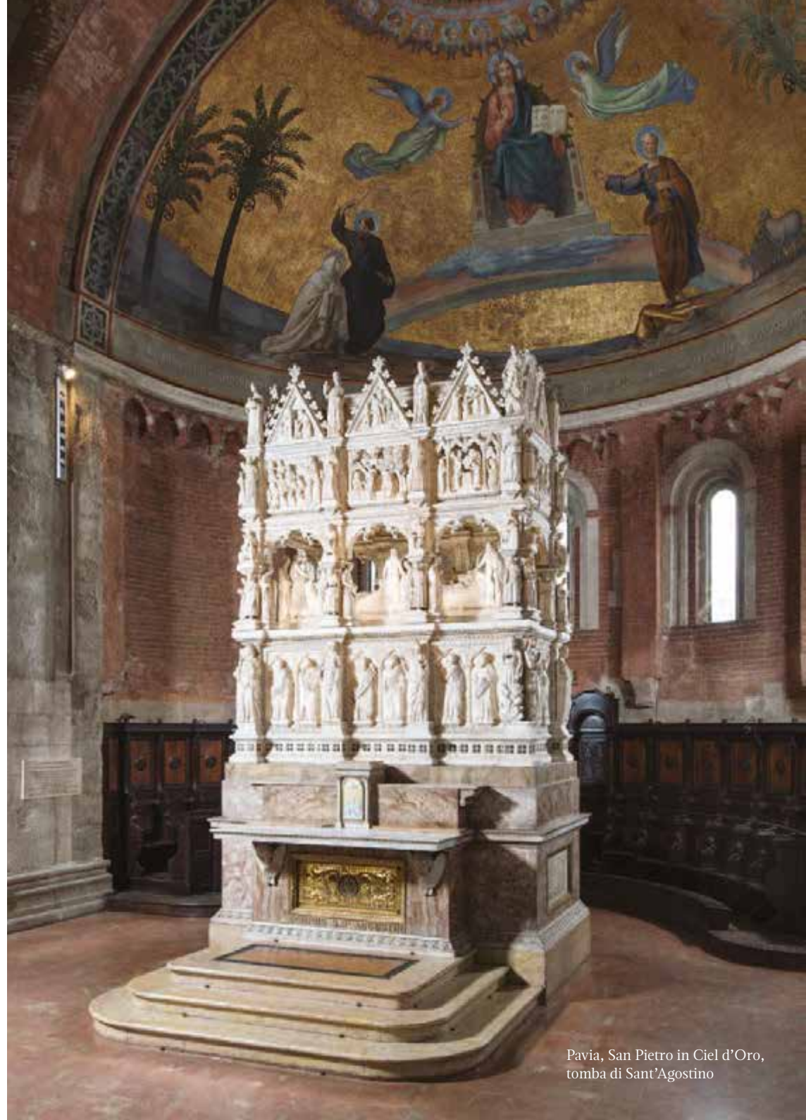
Pavia, San Pietro in Ciel d'Oro, tomba di Sant'Agostino

Partenza per Villa Cagnola Gazzada Schianno