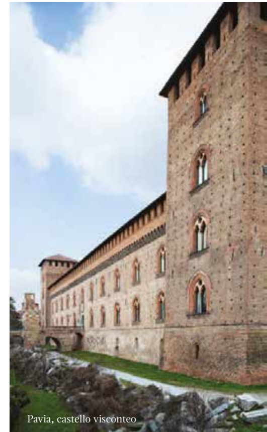
Pavia, castello visconteo